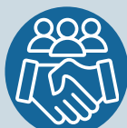
IMAGEM E ENGAJAMENTO

Fortalecer e divulgar o Hóquei em todo país.